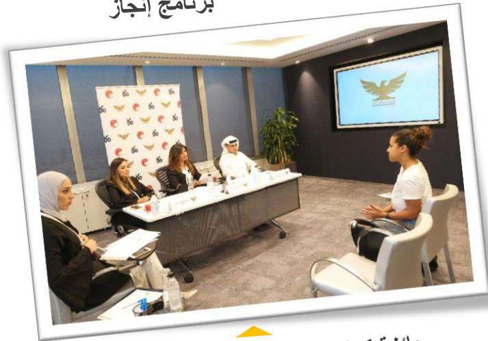
جائزة كيبكو تمكين لدعم مشاريع الشباب